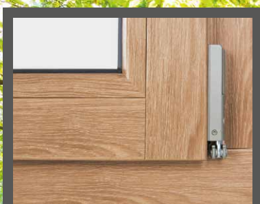
Abb.: HOLZLOOK-Ecke mit stumpfem Stoß – alternativ auch mit dezentem Gehrungsfuge erhältlich.

ZUSÄTZLICH BIS ZU 20% FÖRDERUNG AUF DEN GESAMTBETRAG MÖGLICH